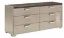
DRESSER KJBP120 With 6 drawers

inch W 65" D 21" H 32" cm L 165,3 P 52,8 H 80,3 Crts 1 kg 102 m 3 0,80