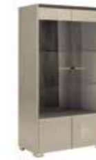
2/D CURIO CABINET PJB0600 With 2 glass doors

inch W 77"/98" D 43" H 30" cm L 196/250 P 108 H 76 Crts 3 kg 116 m 3 0,60