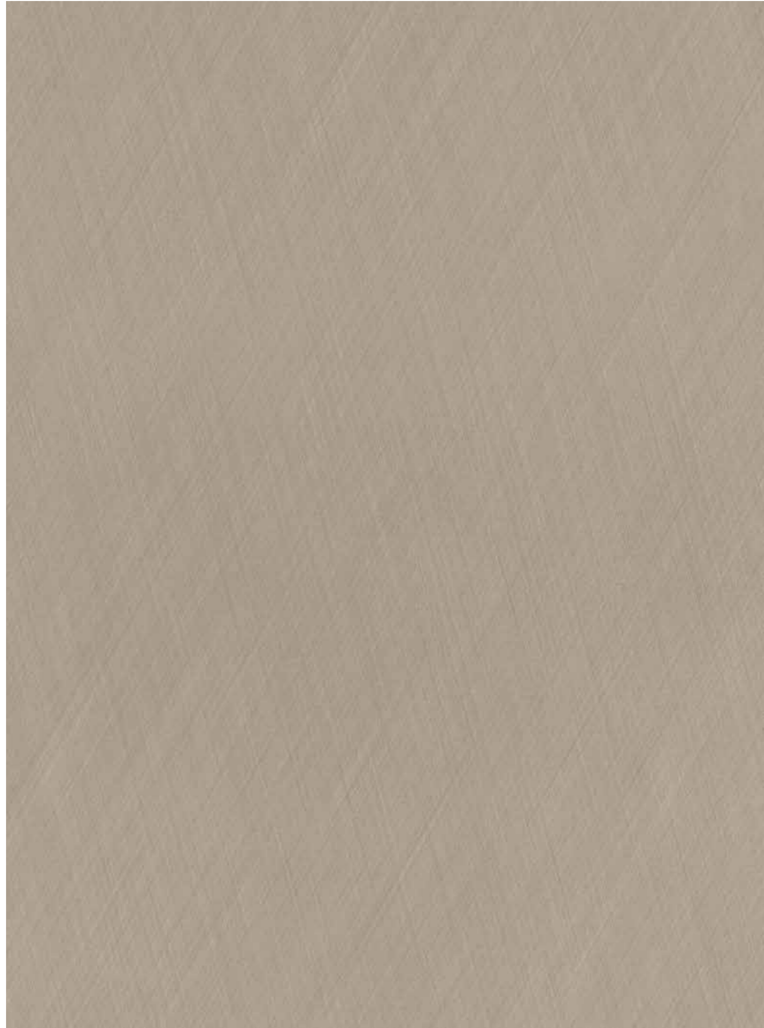
BEIGE DECOR HIGH GLOSS