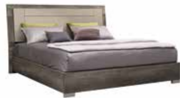
Q.S./UK 5" BED PJB0150

With 1 glass door inch W 20" D 20" H 73" cm L 51,2 P 51 H 185 Crts 1 kg 68 m 3 0,62