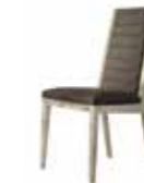
1 CHAIR KJBP621

With 3 doors inch W 68" D 21" H 27" cm L 173 P 52,7 H 67,5 Crts 1 kg 85 m 3 0,71