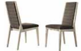
2 CHAIRS KJBP620

1 CHAIR (UK FIRE RETARDANT) KJBP621I With Beige decor high gloss structure, seat and back in fabric inch W 19" D 24" H 40" cm L 49 P 60,5 H 101,5 Crts 1 kg 15 m 3 0,46