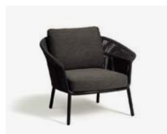
LAKE POLTRONA / LOUNGE ARMCHAIR cod 535/AT P92 h84 h80 h43 X2