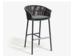
LAKE SGABELLO / STOOL cod 656/AT P60 h58 h106 h84 P42