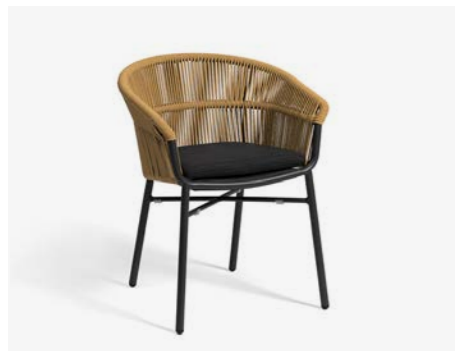
POLTRONCINA LAKE COD 732/SEN