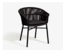
LAKE POLTRONCINA / ARMCHAIR cod 732/AT P61 h57,5 h77 h49 P43 X5