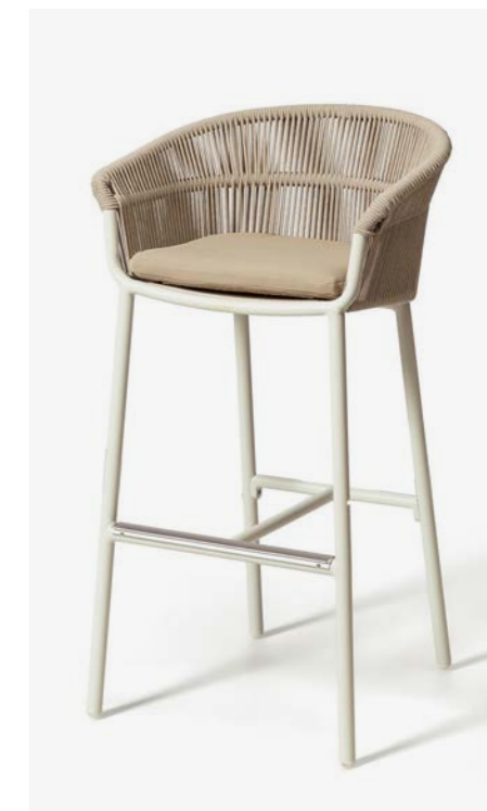
SGABELLO LAKE COD 656/BCO

Barstool with polyester powder-coated aluminium frame, back is covered with hand-woven synthetic rope. The cushion has a removable PVC fabric cover and quick dry padding. Footrest is protected by a satin-finished aluminum slat.