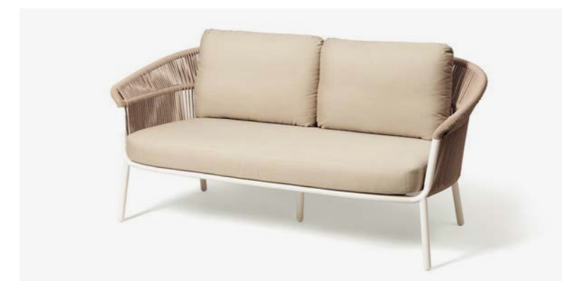
DIVANO LAKE COD 536/BCO