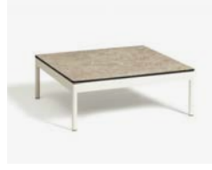
BERGEN TAVOLINO / COFFEE TABLE cod 547/BCO-EMP P75 P75 P28