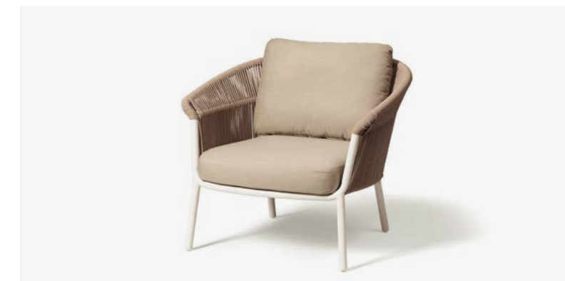
POLTRONA LAKE COD 535/BCO