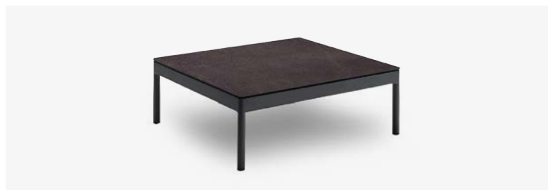
TAVOLINO BERGEN COD 547/AT-ARDE