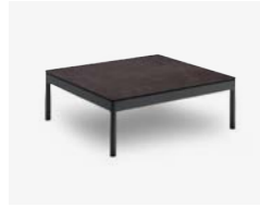
BERGEN TAVOLINO / COFFEE TABLE cod 547/AT-ARDE P75 P75 P28