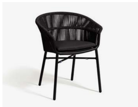
POLTRONCINA LAKE COD 732/AT