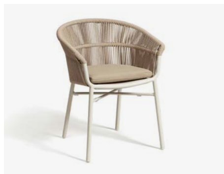
POLTRONCINA LAKE COD 732/BCO

Armchair with polyester powder-coated aluminum frame, back is covered with hand-woven synthetic rope. The cushion has a removable PVC fabric cover and quick dry padding.