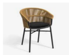
LAKE POLTRONCINA / ARMCHAIR cod 732/SEN P61 h57,5 h77 h49 P43 X5