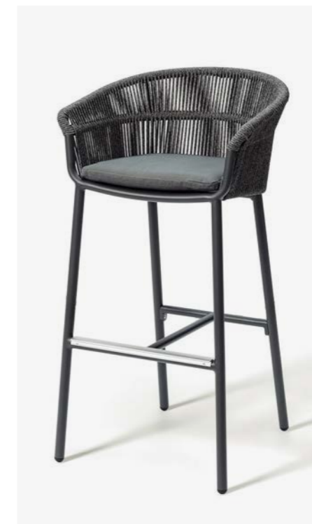
SGABELLO LAKE COD 656/AT