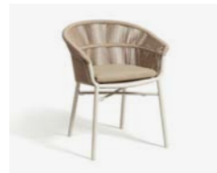
LAKE POLTRONCINA / ARMCHAIR cod 732/BCO P61 h57,5 h77 h49 P43 X5