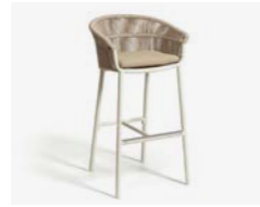
LAKE SGABELLO / STOOL cod 656/BCO P60 h58 h106 h84 P42