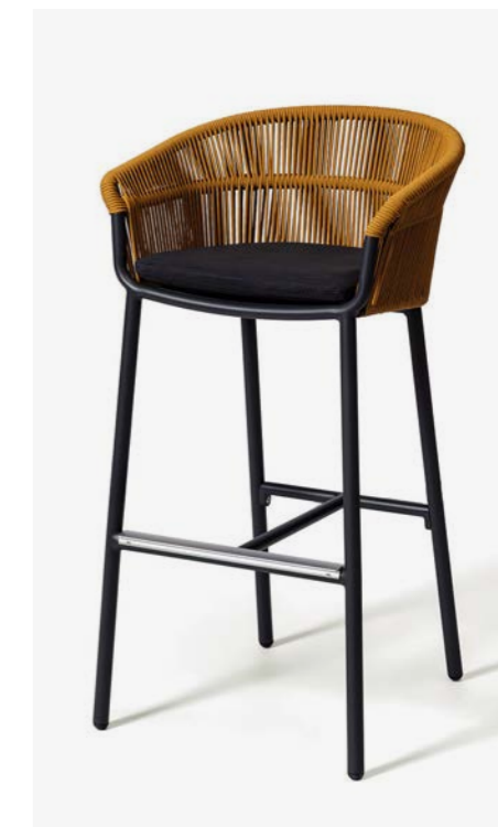
SGABELLO LAKE COD 656/SEN