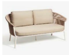
LAKE DIVANO / 2 SEATER SOFA cod 536/BCO P176 h84 h80 h43 X2