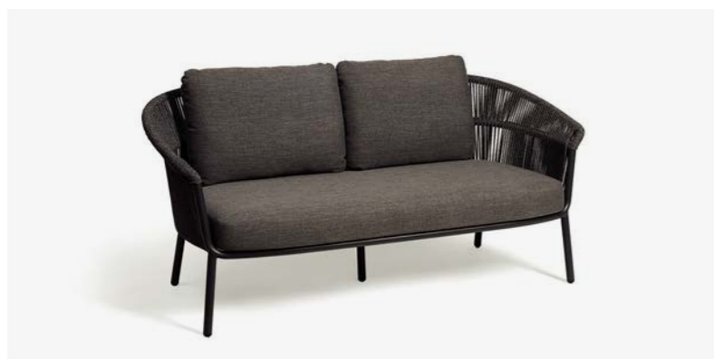
DIVANO LAKE COD 536/AT