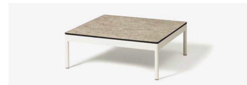
TAVOLINO BERGEN COD 547/BCO-EMP