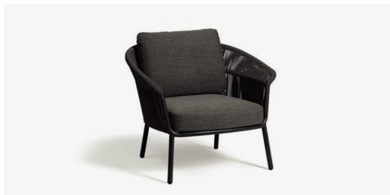
POLTRONA LAKE COD 535/AT