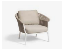
LAKE POLTRONA / LOUNGE ARMCHAIR cod 535/BCO P92 h84 h80 h43 X2