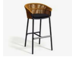
LAKE SGABELLO / STOOL cod 656/SEN P60 h58 h106 h84 P42

Le misure riportate nel presente catalogo sono da ritenersi approssimative. Differenze di tonalità dei materiali rispetto a quanto illustrato nel catalogo non possono essere causa di contestazioni. Contral si riserva il diritto di apportare modifiche agli articoli in qualsiasi momento.