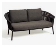
LAKE DIVANO / 2 SEATER SOFA cod 536/AT P176 h84 h80 h43 X2