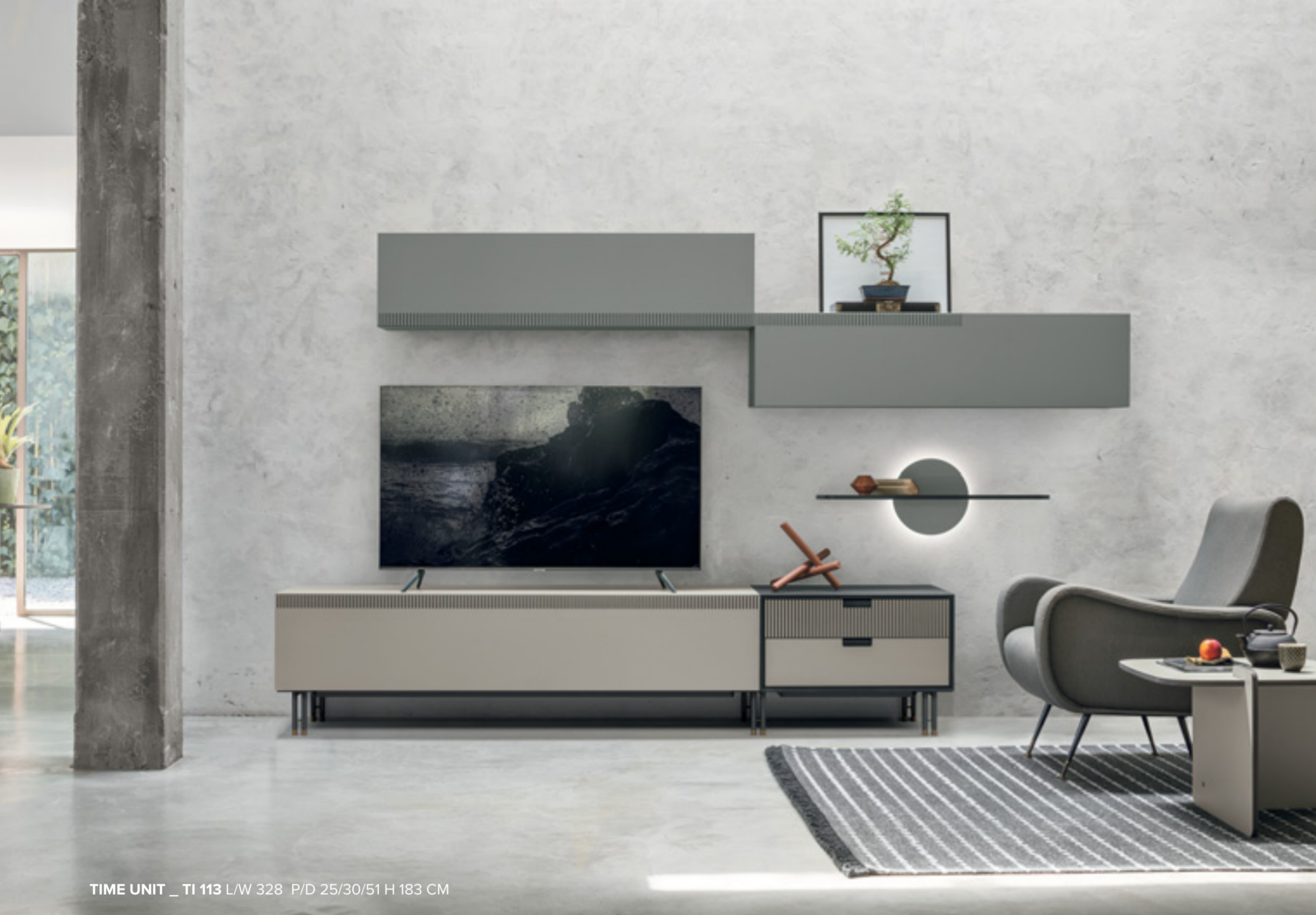
TIME UNIT _ TI 113 L/W 328 P/D 25/30/51 H 183 CM