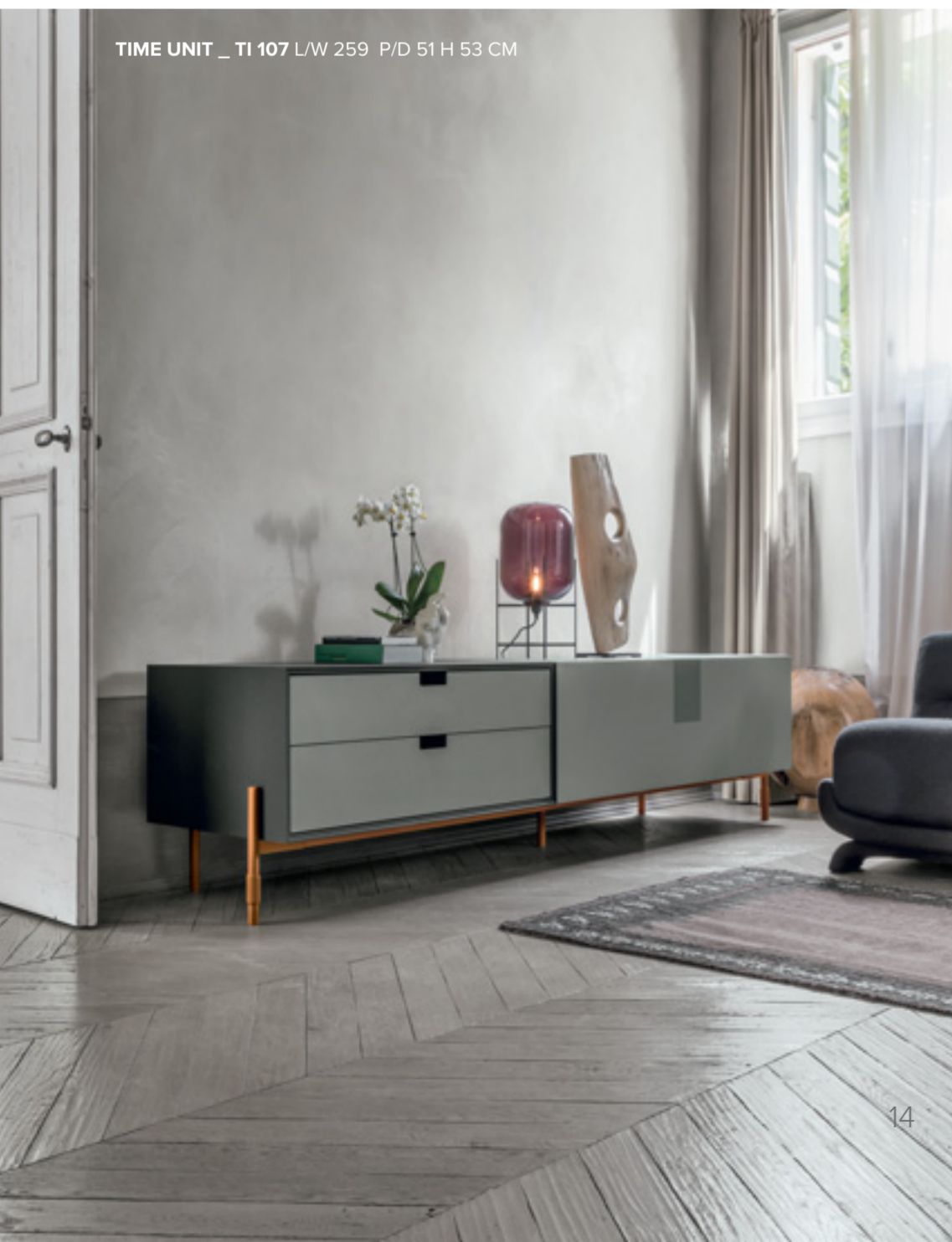
TIME UNIT _ TI 107 L/W 259 P/D 51 H 53 CM

La cassettera Time Box, racchiusa dalla sua anima nera, si integra ai lati delle basi in due diversi ambienti, portando in ognuno la propria personalità: nel primo living, il cassetto superiore è decorato con un effetto cannettato che dà continuità alla lavorazione del contenitore; nell'altra stanza, i cassetti sono lisci e uniformi per un look più minimale ma sempre d'impatto. Due tipologie di basamenti: Tracks con dettaglio bronzo nella composizione in alto e basamento Time laccato colore in basso.