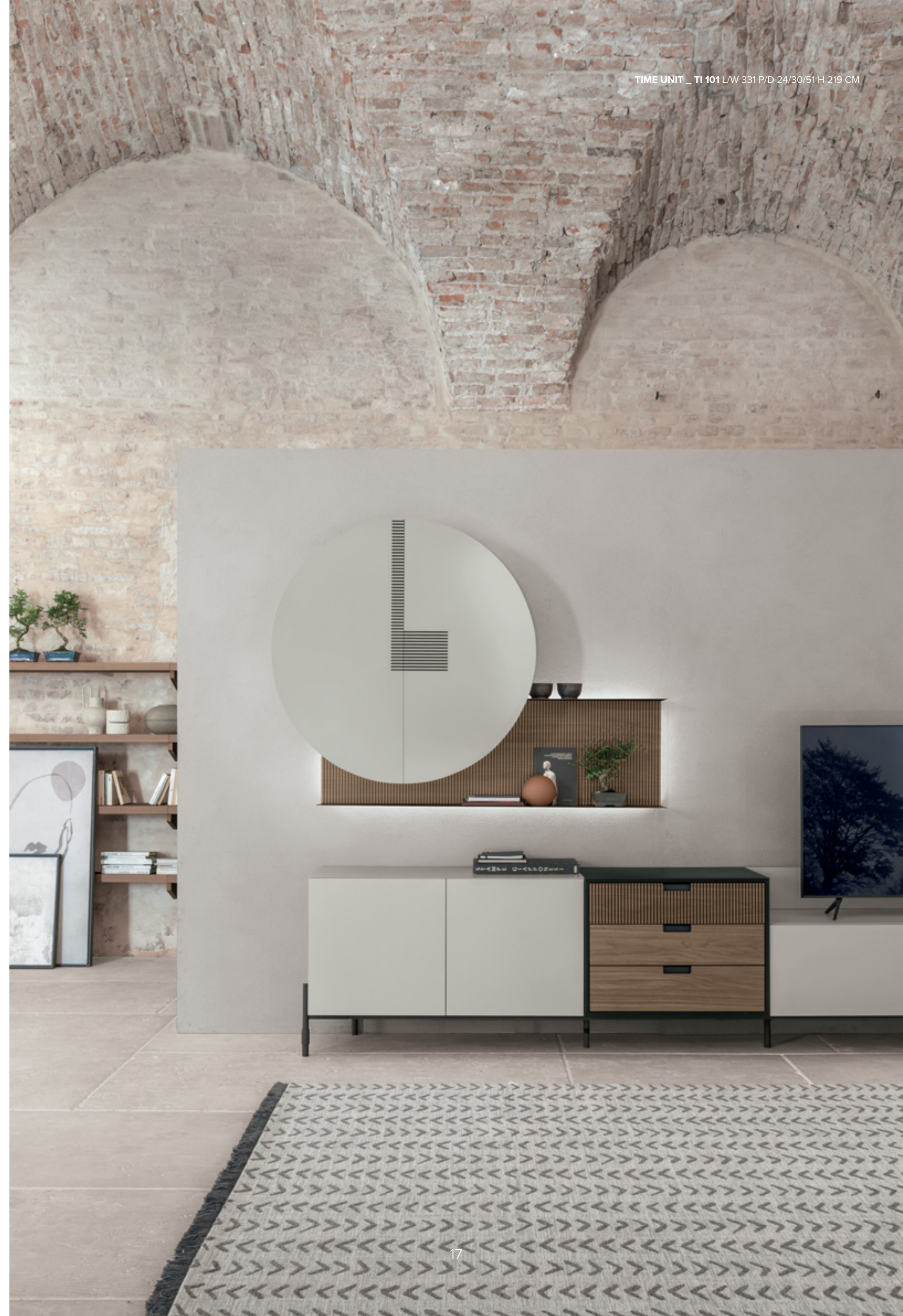
TIME UNIT _ TI 101 L/W 331 P/D 24/30/51 H 219 CM

The Time Box drawer unit fits in perfectly between the modules that make up the base of the two different living room arrangements: the floor-standing one features a natural grain match and picks up the reeded-effect finish on the top drawer while the other arrangement stands out for the distinct differences in its finishes. In both cases the wall units add to their geometry and style.