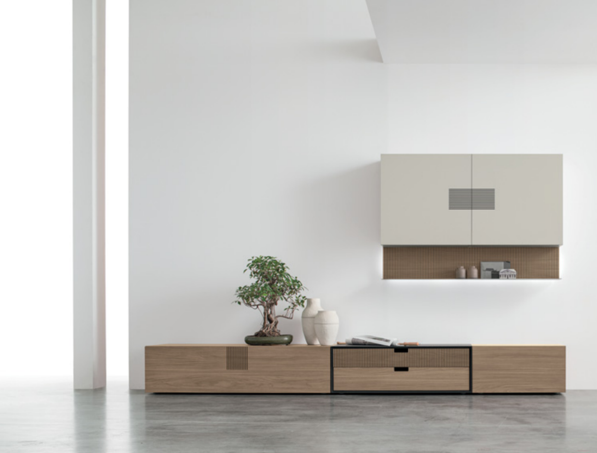
TIME UNIT _ TI 103 L/W 324 P/D 24/30/51 H 183 CM