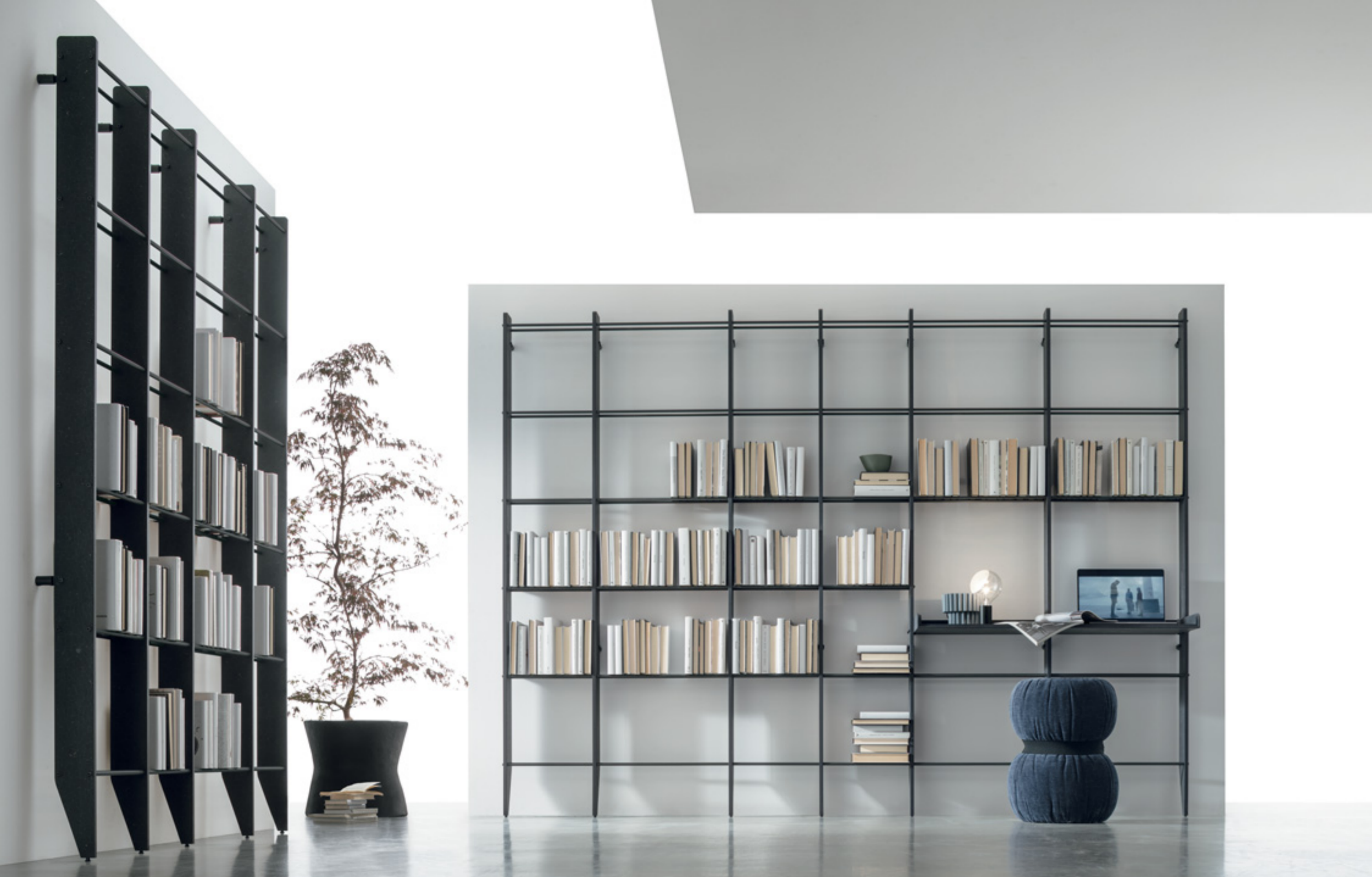
TIME UNIT _ TI 122 L/W 282 P/D 40 H 207 CM - TIME UNIT _ TI 123 L/W 170 P/D 15 H 207