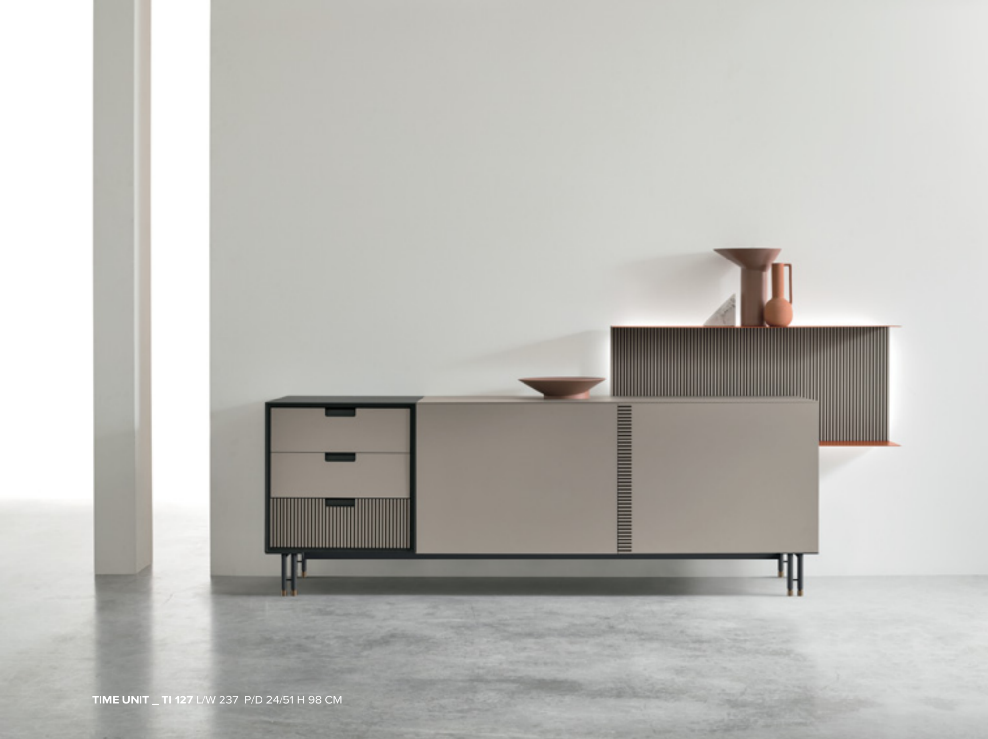
TIME UNIT _ TI 127 L/W 237 P/D 24/51 H 98 CM