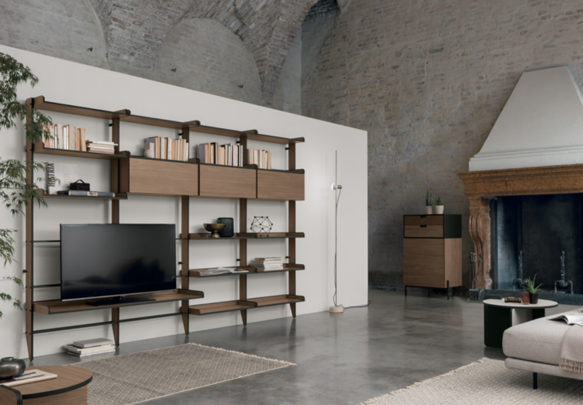
TIME UNIT _ TI 119 L/W 296 P/D 30/40 H 207 CM