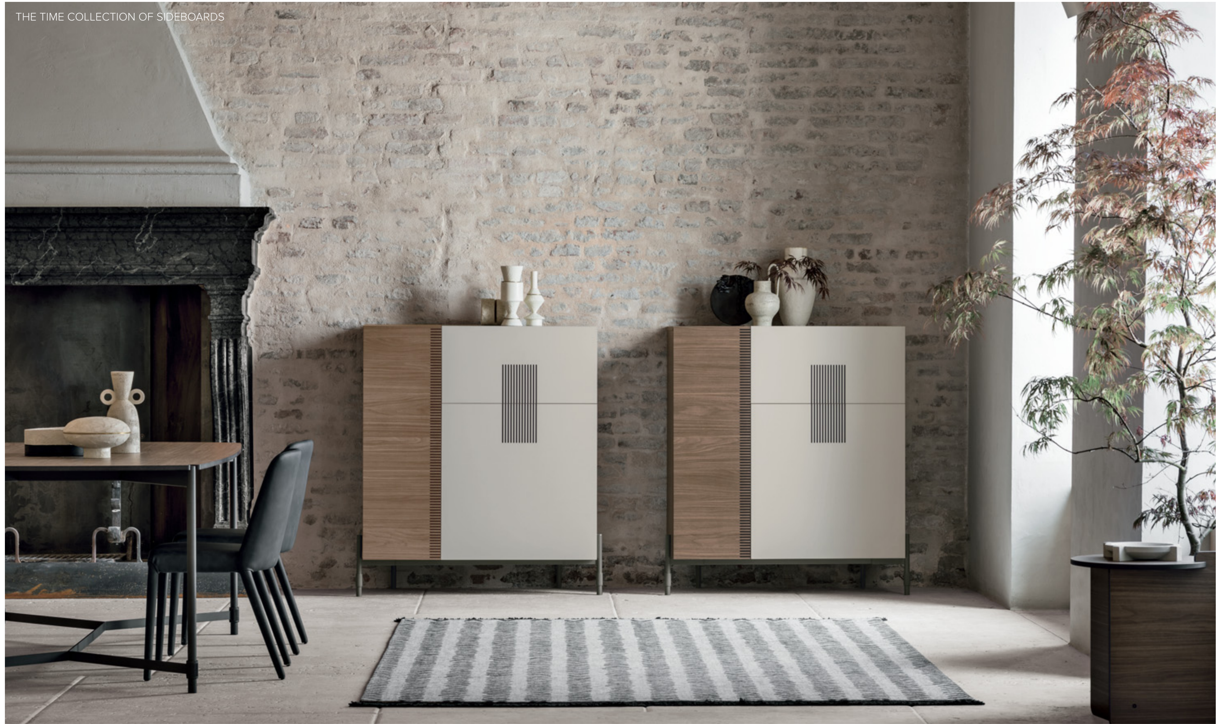
TIME UNIT _ TI 102 L/W 115 P/D 51 H 125 CM