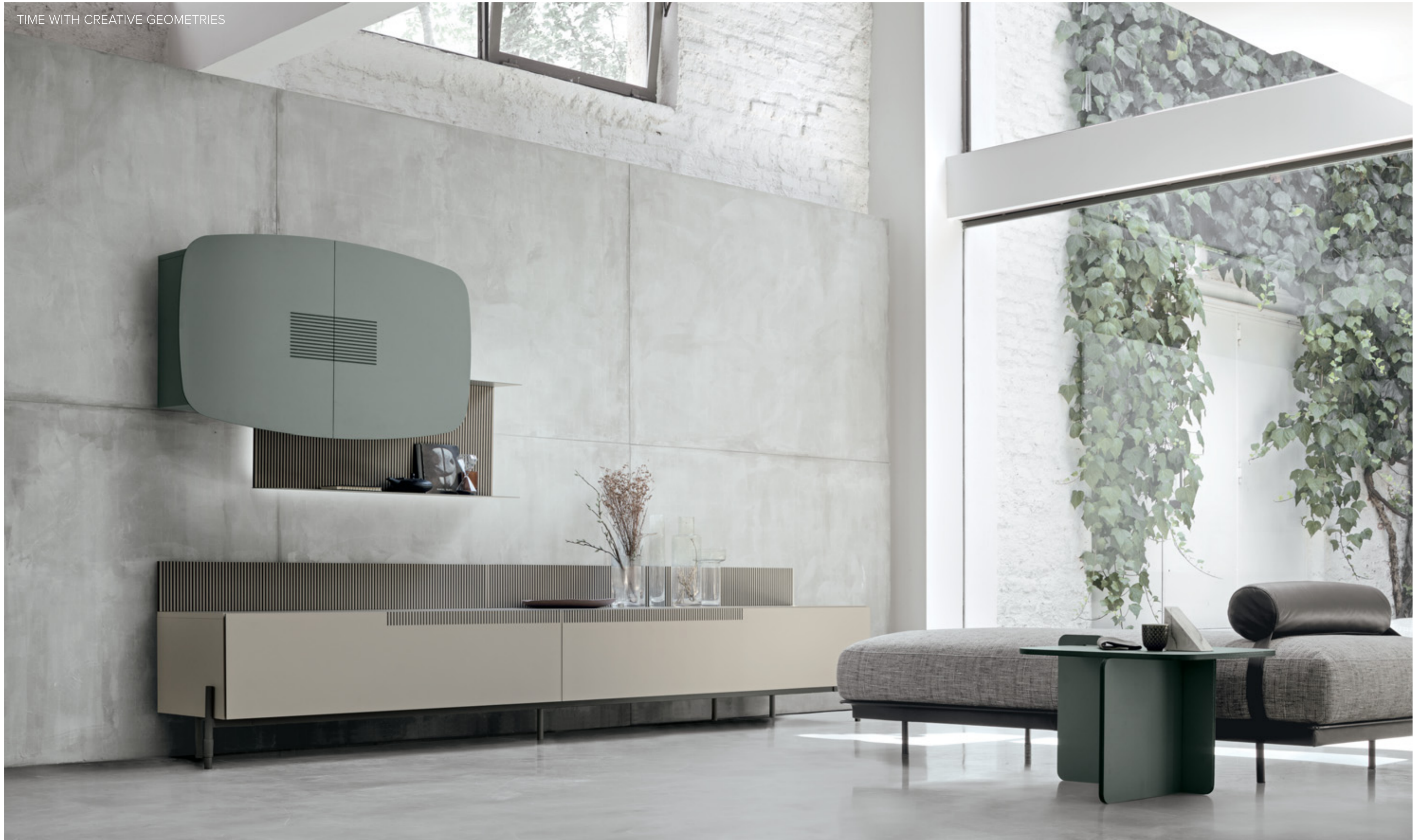
TIME UNIT _ TI 111 L/W 331 P/D 24/30/51 H 183 CM