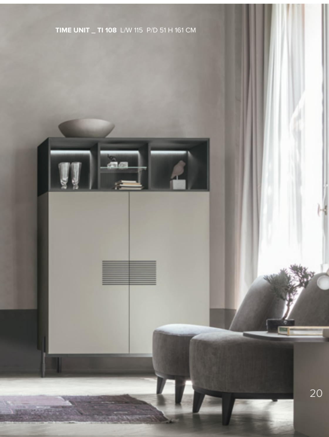
TIME UNIT _ TI 108 L/W 115 P/D 51 H 161 CM

Time Box si integra anche alle madie, in versione cassetiera o nicchia con vano a giorno, per caratterizzare l'arredo con diverse geometrie ed elementi. Nella versione a tre cassetti, la madia ha un'unica finitura ma la lavorazione cannettata impreziosisce il cassetto inferiore; nella madia con nicchia, la parte superiore è aperta al contenimento e valorizzata da luci a led; nella variante con due cassetti, c'è un cambio di finitura.